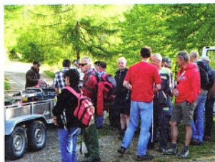
Rendez-vous au petit matin

Adresse postale : mairie de Saint-Michel de Chaillol